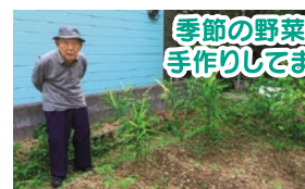
季節の野菜も 手作りしています♪

元町で5人きょうだいの4番目として生まれ、小学6年時に空襲体験し家族で避難した子ども時代、食事に苦労した事を今でも鮮明に覚えていると話して下さいました。