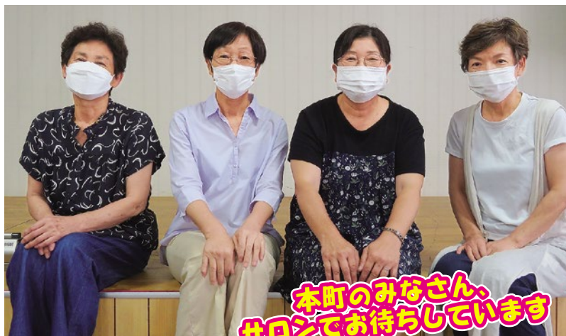
本町のみなさん、 サロンでお待ちしています