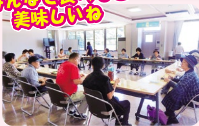
みんなで食べると 美味しいね