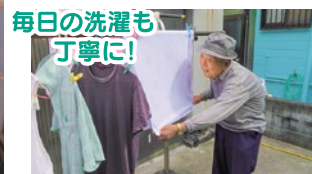
毎日の洗濯も 丁寧に!