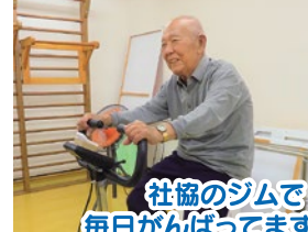
社協のジムで 毎日がんばってます~☆

社協のジムにも毎日通い、黙々とトレーニングに励まれています。日常生活を楽しみながら過ごされている保昌さん、これからも元気にお過ごし下さいね!